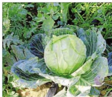
Col de cabdell.